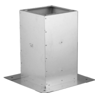
Bullerdämpande stativ RSA