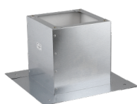
Bullerdämpande stativ RS